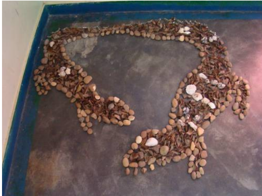
Montagem sobre desenho de Carmela Gross, materiais diversos