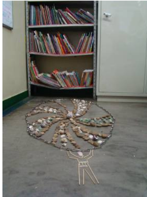
Montagem sobre desenho de Alex Cerveny, materiais diversos

Nossas intervenções temporárias ficaram expostas e duraram o suficiente para serem vistas por todos os frequentadores da escola.