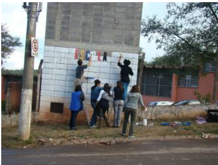
Pintura da entrada principal da escola

Iniciamos também uma pintura na entrada da Escola, escolhemos um muro na fachada, cobrimos com látex branco a pichação existente e com matrizes de letras em estêncil, começamos nossa pintura. A participação foi muito boa e os funcionários compareceram em peso desta vez.