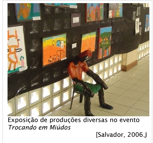
Exposição de produções diversas no evento Trocando em Miúdos