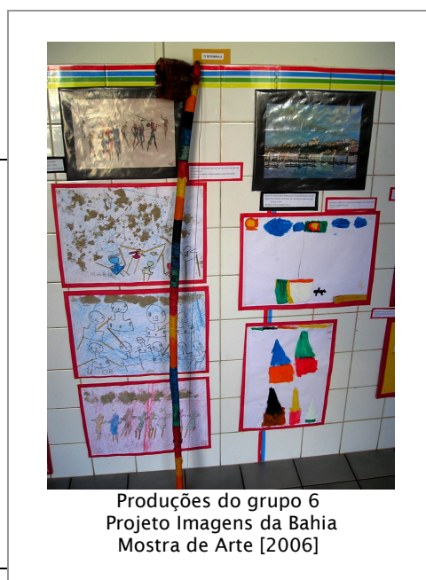
Produções do grupo 6 Projeto Imagens da Bahia Mostra de Arte [2006]