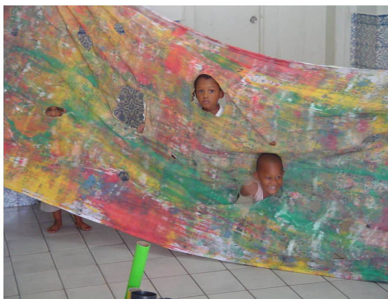
Projeto Vivenciando a Arte / grupos 1 e 2 Mostra de Arte no CEI Juracy Magalhães [2005 e 2006]