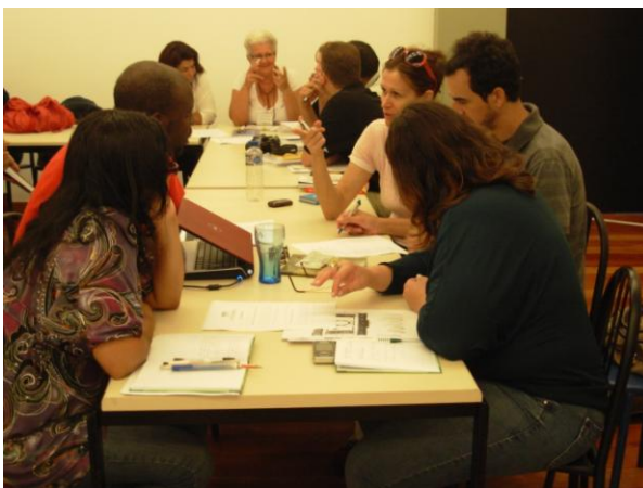
Dinâmica para discussão sobre objetos em museus.