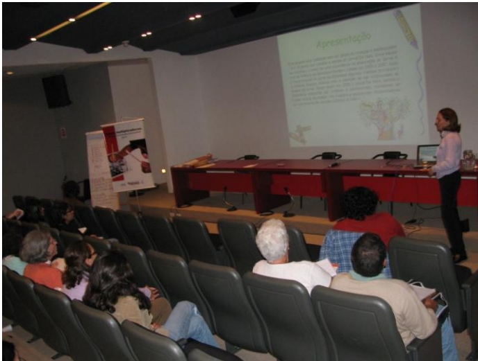
Educadora do Instituto Espaço Arterial apresenta seu projeto educativo elaborado durante o curso no auditório da Estação Pinacoteca.