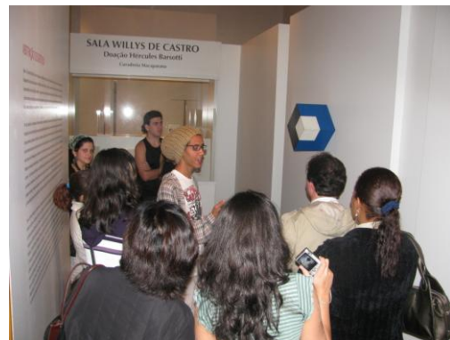
Visita educativa à Pinacoteca para grupos oriundos do Educafro Núcleo Quilombo Pai Felipe, como parte do projeto da educadora desta instituição.