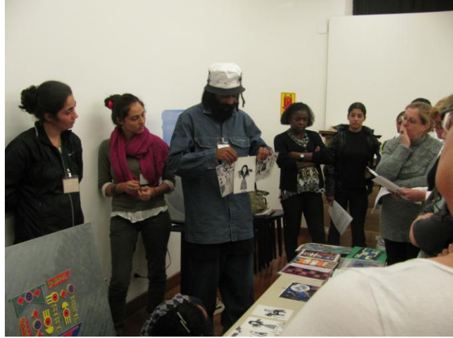
Educadores apresentam os recursos educativos elaborados.