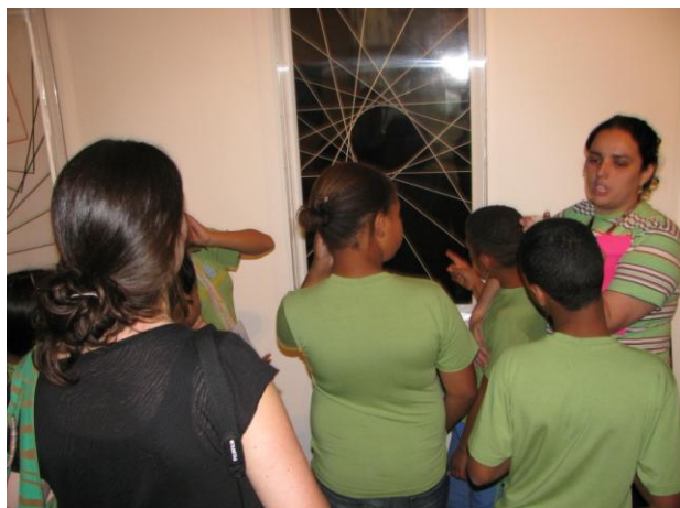
Visita educativa de grupo de crianças da ONG Alquimia à Sala de Abstração Geométrica da exposição do acervo da Pinacoteca, como parte do projeto da educadora desta instituição.