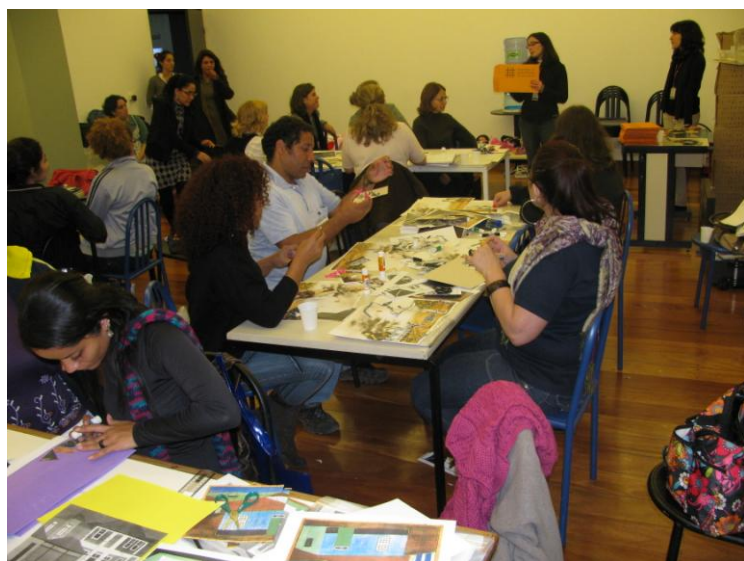
Encontro para o desenvolvimento de recursos educativos.