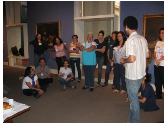
Imagens do primeiro encontro com os educadores sociais no auditório e no acervo da Pinacoteca.