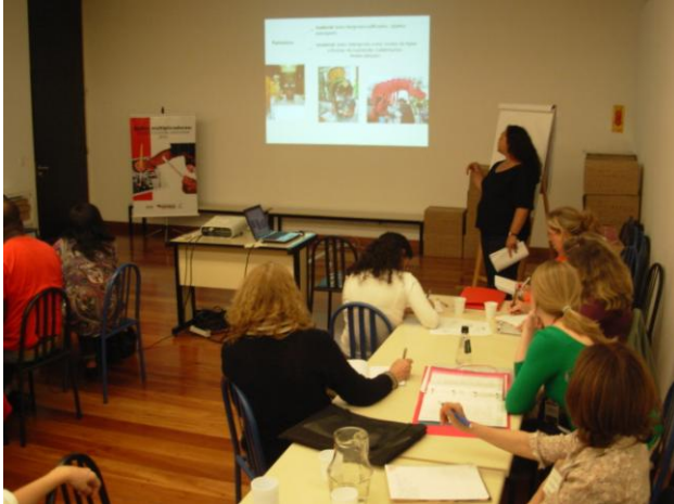
Discussão sobre função social dos museus, no espaço do educativo na Estação Pinacoteca.