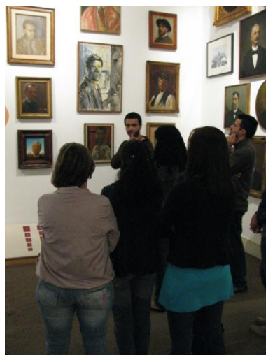
Grupo de educadores do CCA Raio de Sol durante visita educativa à Pinacoteca, como parte do projeto da educadora desta instituição.