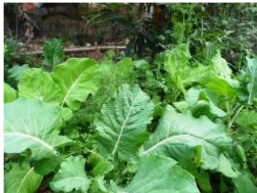
A horta que está sendo organizada na E. M. Jardim Magali com alimentos prontos para o consumo.