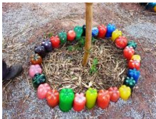
Algumas das soluções criativas da equipe da E. M. Jardim Magali.