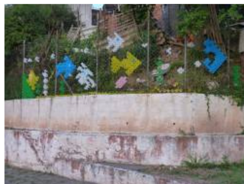
Antes e depois do alambrado. A paisagem que demonstra uma situação precária em relação ao poder público, torna-se renovada mais divertida, mais suave de acordo com os pequenos estudantes que atende.

Todos se envolveram no processo de construção da composição escolhida. O trabalho ficou muito bem acabado e temos certeza de que as crianças devem ter ficado muito contentes com a novidade colorida!