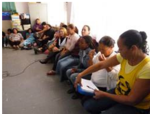
A apresentação da proposta de trabalho para esta interação.

Depois, fomos o refeitório onde dividimos todos em cinco mesas. Entregamos uma folha quadriculada já com o padrão da grade/ alambrado que circunda e protege a escola de seu entorno. Nela, propomos que cada funcionário fizesse sua composição inspirado no trabalho do artista australiano Andy Uprock que utiliza copos coloridos para desenhar em alambrados de diversos lugares. Explicamos para todos que cada pequeno quadrado na folha correspondia a um copo.