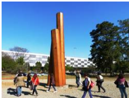
Todos observando e conversando sobre as obras de arte do Jardim das Esculturas do MAM.