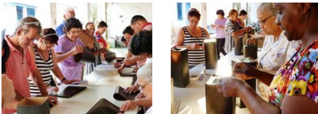
O processo de construção da câmara escura: passo a passo, tudo feito com calma.

Introdução finalizada, arrumamos todos os materiais e fomos para o lado externo da sala de aula. Passo a passo, os alunos foram construindo as suas câmaras. Tivemos o auxílio da coordenadora e de uma estagiária. Como o grupo era composto por alguns idosos, os mais hábeis iam auxiliando os demais muito gentilmente. Mostramos como colar as fitas adesivas, cortar com estilete, tudo de forma descontraída. Percebemos que para este grupo, esta foi uma experiência ímpar, tanto que alguns queriam saber quando retornaríamos antes mesmo da produção ser finalizada.