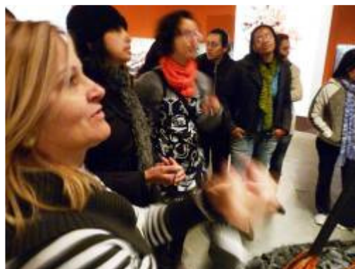
Funcionários da E. M. Dr. Idoque Rosa em visita a exposição do Frans Krajcberg.

Estas questões também se explicitaram durante a visita ao Jardim das esculturas do MAM. A expressão “não gosto” que comumente ouvíamos, se transformou em “por que” no desejo de saber mais sobre os objetos expostos, de compreender os motivos pelos quais uma escultura de formas retas e aparentemente simples em sua execução é uma importante obra de arte, ou ainda, dar-se o tempo da observação, da decifração de obras como a “Craca” do artista Nuno Ramos.