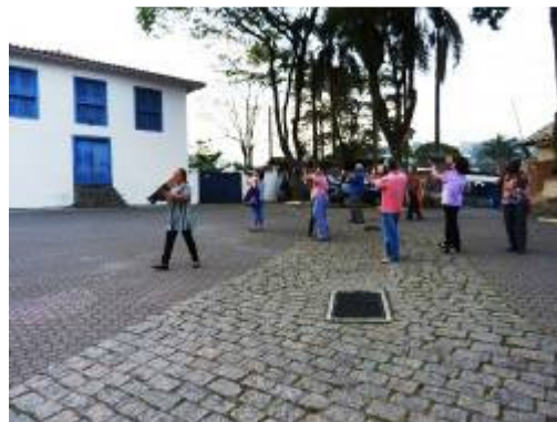
O grupo de alunos do EJA nos arredores da escola experimentando a invenção!

Dando continuidade às ações que serão desenvolvidas entre o projeto “Embu com Arte” e as demais escolas finalistas desta frente, no dia 25 de agosto, das 14h às 18h, realizamos a nossa primeira interação com os 40 funcionários da E. M. Vista Alegre. A nossa proposta para este encontro considerou o diagnóstico da direção da escola sobre as melhorias vislumbradas. Neste caso, focamos o alambrado externo que circunda parte da instituição.