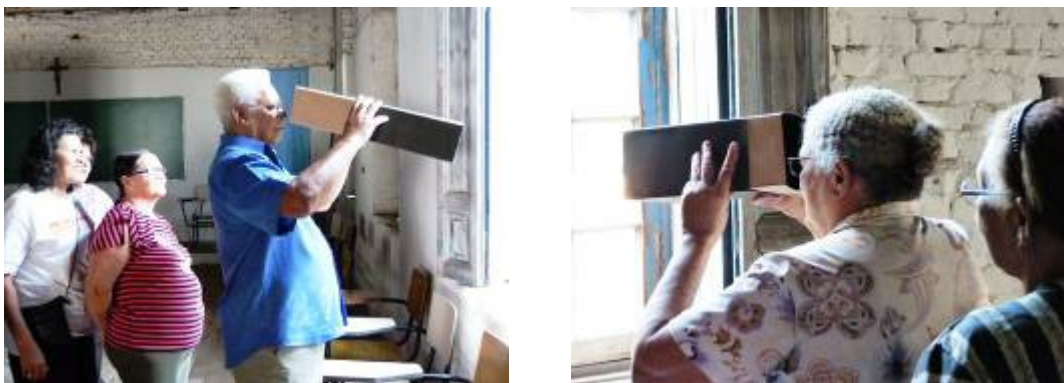
Os alunos experimentando a câmara escura que levamos pronta. Muitos se surpreenderam com este mundo invertido!

Nos apresentamos para os alunos, em torno de 20 pessoas incluindo ao a netinha de uma delas, e iniciamos a interação situando-os em relação ao tema que seria trabalhado: a câmara escura. Apresentamos os princípios que envolvem a mesma e entregamos um breve texto que contem informações mais detalhadas. Levamos uma câmara escura pronta para que eles experimentassem a mesma.