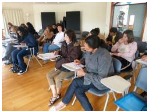
A recepção do grupo de participantes após o nosso recesso. O tema deste encontro reuniu "Arte e Ambiente" e "Site Specific".