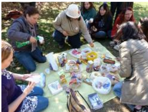
Aproveitamos o contato com o verde do parque também para realizar o nosso lanche: um piquenique colaborativo!

Este dia foi muito especial. Torcemos para que os funcionários da E. M. Dr. Iodoque Rosa reconheçam no Parque Ibirapuera, que muitos não conheciam, um espaço de lazer e de aprendizagem, de diálogos via arte que nos trazem reflexões sobre o mundo em que vivemos!