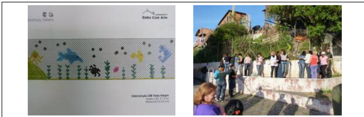
A composição selecionada pelo grupo de funcionários e os mesmos trabalhando em sua construção.

As pessoas foram se encantando aos poucos com as imagens que foram se formando. O resultado ficou muito harmonioso e esperamos que as crianças tenham se surpreendido com esta composição feita por todos com muita energia boa.